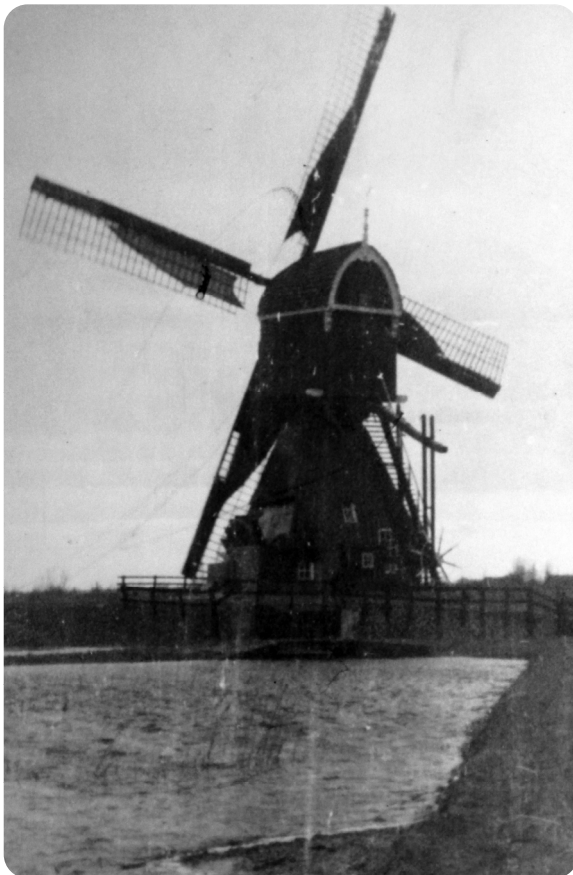
De Sluismolen in Streefkerk, gezien vanaf de 'Kulk', de lage boezem.