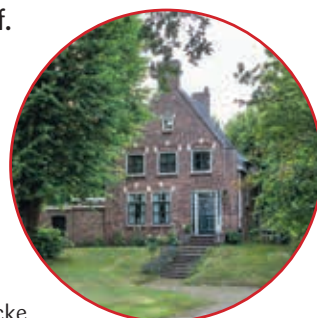
15. Huis Ter Specke

Het dorp Lisse is ontstaan op de strandwal, tussen de duinen en het Haarlemmermeer en wordt in 1198 voor het eerst genoemd. Het oudste gebouw van Lisse is de 14de-eeuwse versterkte woontoren 't Huys Dever. In de 17de en 18de eeuw vestigden rijke stedelingen hier fraaie buitenplaatsen. De binnenduinen en vrijwel alle landgoederen zijn later afgegraven voor de zandwinning en de bloembollenteelt. Uitzondering is landgoed Keukenhof. Met het aangrenzende duinbos, de Lageveense polder en de hakhoutbossen is het landgoed in alle jaargetijden een bezoek meer dan waard. De route voert verder door het historische hart van Lisse, langs 't Huys Dever en restanten van Huis Ter Specke en landgoed Wassergeest.