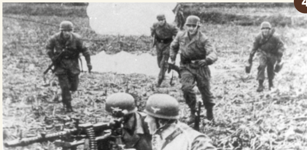
4. Meidagen 1940: Duitse parachutisten zijn op en rond het vliegveld geland.

De herinnering aan Vliegveld Valkenburg en haar rijke geschiedenis levend houden, dat is wat Stichting Historie Vliegveld Valkenburg wil. Gebouw 250 op het voormalige marinevlieggkamp verandert in een bezoekerscentrum met een permanente expositie, thema-exposities, een veteranencafé en lesmogelijkheden. Kijk voor openingstijden op www.vliegveldvalkenburg.nl .