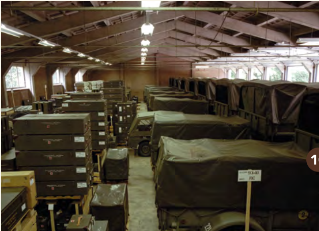
10. Een met Maaldrift vergelijkbaar mobilisatiecomplex in Mijdrecht (1992).

Op de foto zie je hoe zo'n boei via de onderzijde in het vliegtuig werd geplaatst. Daarna controleerde de monteur het contact met de boei. Was dat in orde, dan was de boei klaar om tijdens de vlucht te worden uitgeworpen. Er waren dertien Orions op het Marinevliegkamp Valkenburg gestationeerd.