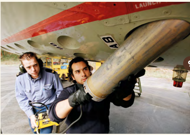
9. Het plaatsen van een sonarboei aan de onderzijde van de Lockheed P-3C Orion (1994).