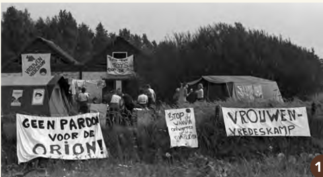
15. Vrouwen richten vlakbij het vliegveld een Vrouwen Vredeskamp in (1982).

Na 1996 zijn de bollenbedrijven verplaatst. Het gebied is veranderd in een glooiend terrein met beken en plassen. Er zijn al meer dan honderd soorten vogels waargenomen. Naast de hier uitgezette Schotse Hooglanders en Koniks paarden komen hier reeën, vossen en hazen voor. Je kunt er wandelen over het speciaal aangelegde graspad. Het natuurgebied is zó bijzonder dat het op Europees niveau wordt beschermd in het Natura 2000-programma.