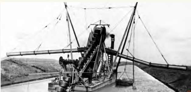
16. De tankgrachten werden met enorme baggermolens in een paar maanden tijd gegraven.

vrouwen op de hoek van de Katwijkseweg en Ruigelaan een tentenkamp in. Ze bleven er veertien dagen. Met hun protest wilden zij de Nederlandse regering ervan overtuigen dat de Orions geen atoombommen moesten gaan uitvoeren. De vrouwen vonden dat juist zij dit protest moesten voeren omdat vrouwen in oorlogstijd vaak slachtoffer zijn. Hun protest was in die tijd een van de vele protesten tegen atoombommen in Nederland.