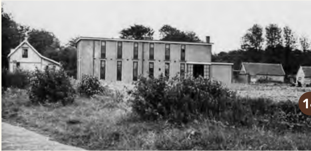
14. Een bollenbedrijf aan de Katwijkseweg (circa 1945).

Meer informatie: www.staatsbosbeheer.nl en www.bunkersinwassenaar.nl .