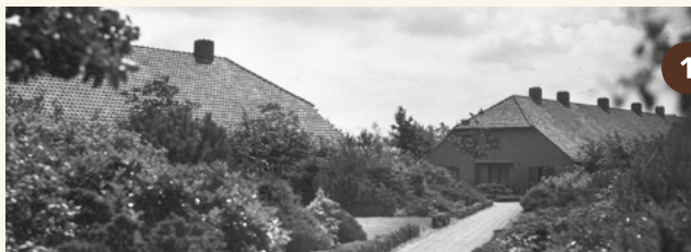
1. Doorkijk in het Barakkendorp (rond 1950).