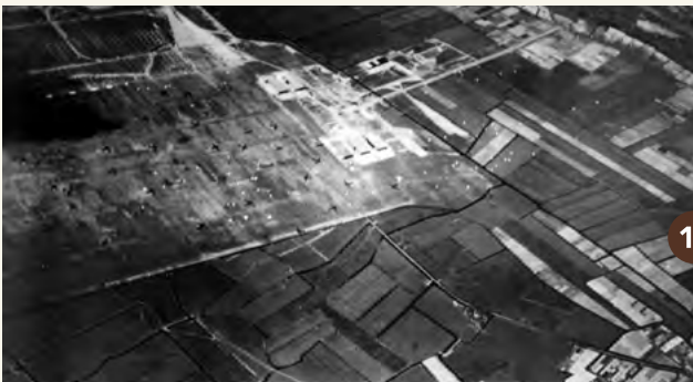
11a. Vliegveld Valkenburg in de meidagen van 1940, bezaaid met gestrande Duitse transportvliegtuigen.

De meeste van de MOB-complexen stammen uit de tijd van de Koude Oorlog. In de periode 1951-1961 zijn er in heel het land ongeveer honderd gebouwd.