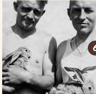
6b. Duitse soldaten met door hen gefokte konijnen (1941).