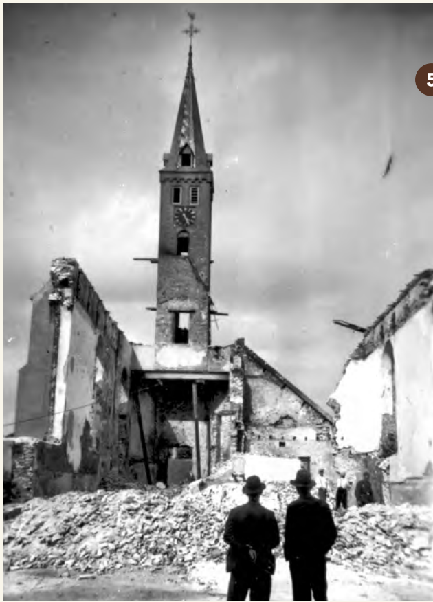
5. De Hervormde Kerk na de capitulatie van Nederland (mei 1940).

Ga verder op het fietspad aan de noordzijde van de Ir. Tjalmaweg (N206). Sla bij fietsknooppuntbord 89 linksaf de Broekweg op en volg deze tot aan het Castellumplein.