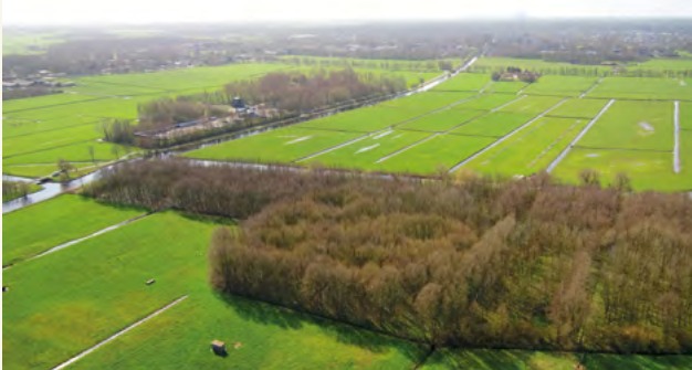
11b. De tankgracht, ooit bedoeld om vijandelijke tanks tegen te houden, vormt nu een verbinding tussen de natuurgebieden Berkheide en de Ommedikse polder (2020).

zakten tot aan hun assen in de drassige grond. De volgende groep week daarom uit naar het strand. Nog dezelfde dag heroverden Nederlandse soldaten het vliegveld. De overwinning was van korte duur, een paar dagen later capituleerde ons land. Na de oorlog werd op deze plek nog meer geschiedenis geschreven toen het vliegveld een van de marinevliegkampen van de Marineluchtvaartdienst werd. Links zie je een tankgracht. Die moest voorkomen dat de geallieerden het vliegveld konden oprijden en de Stützpunktgruppe Katwijk zouden binnendringen. De gracht was onderdeel van de Duitse verdedigingswerken van de Atlantikwall . Hitler gaf in 1941 opdracht om deze 5000 kilometer lange verdedigingslinie langs de kust van Noorwegen tot aan de Frans-Spaanse grens te bouwen. In het bos voor je liggen bunkers verscholen. Een paar liggen rechts in het weiland. In de verte is de verkeerstoren te zien. Kijk op het informatiepaneel om meer te weten te komen.