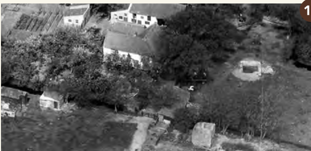
12. Rondom de boerderij liggen Duitse verdedigingswerken (circa 1955).

In de kom van de Kokshornlaan en Oostdorperweg is honderd meter van de weg af vlakbij boerderij Bellesteyn een kleine bakstenen manschappenbunker voor zes man te zien. Het oorspronkelijk met aarde bedekte bunkertje maakte deel uit van een geschutsbatterij van de Duitse landmacht. Het is nu als schuurtje in gebruik. De geschutsbatterij had vier kanonnen waarmee zowel richting zee als land kon worden geschoten. In de oorlog waren er zo'n tien bouwwerken voor de 120 manschappen en hun voorraden, wapens en munitie. Ook verbleven zij in door hen gevorderde woningen. Inmiddels zijn de meeste bunkers afgebroken.