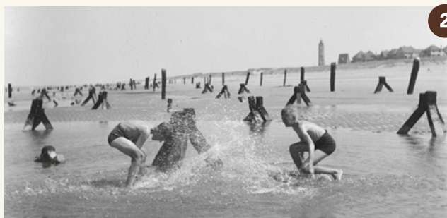
2. Tetraëders op het strand vlak na de oorlog (1945).

Je staat hier op de 'Brink', het centrale deel van het Barakkendorp. Hier waren in de Tweede Wereldoorlog Duitse militairen gelegerd die op het vliegveld werkten. De Duitsers ontwierpen de barakken met opzet als gewone huizen en boerderijen zodat het militaire complex vanuit de lucht op een dorp leek, waardoor geallieerde vliegers werden misleid. Lees er meer over op het informatiepaneel.