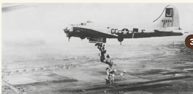
3. Voedseldroppingen boven Vliegveld Valkenburg (april-mei 1945). Links op de achtergrond zie je het Barakkendorp voor de Duitse militairen.

Aan de linkerkant van de weg liggen in het weiland vier kleine munitiebergplaatsen uit de Tweede Wereldoorlog. Doordat de aarde waarmee deze bedekt waren is weggehaald zie je ze nu goed liggen. Op een betonnen horizontale 'plank' konden munitiekisten staan met patroonbanden voor de mitralleuren van de jachtvliegtuigen. Nadat Flugplatz Katwijk in onbruik raakte bij de Luftwaffe (luchtmacht), gebruikten grondtroepen de bergplaatsen voor gewoemunitie of handgranaten. Voor de munitiebergplaatsen steken betonnen palen uit de grond. Met zes van deze palen maakten de Duitsers driehoekige versperringen die ze Tetraëders noemden. Deze plaatsten ze in de branding van de zee zodat geallieerde landingsvaartuigen en tanks niet aan land konden komen. Na de oorlog gebruikten boeren de palen voor het maken van afzettingen.