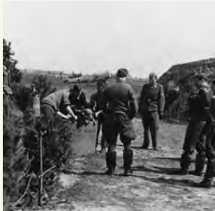
6a. Badtijd voor de honden (1941). De Duitsers hielden ze als huisdieren. Op de achtergrond een Duits jachtvliegtuig.

Ga voor het Castellumplein rechtsaf naar de Kruisweg en sla rechtsaf naar de Burg. Lotsystraat. Ga op de T-splitsing rechtsaf naar de Marinus Poststraat. Sla op de T-splitsing linksaf en bij de volgende T-splitsing rechtsaf en volg de Achterweg. Steek de Ir. Tjalmaweg (N206) over, sla linksaf en blijf de Achterweg volgen. Ga bij de T-splitsing rechtsaf de Zonneveldslaan in.