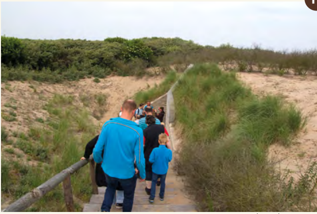
13. De ingang van de vleermuisbunker aan de Wassenaarseweg (2018).