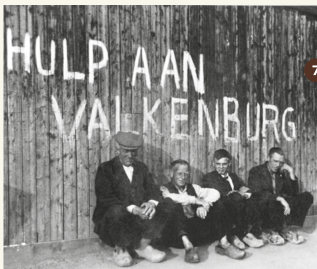
7. Na de gevechten in de meidagen van 1940 wordt voor de zwaar getroffen Valkenburgers een noodactie opgezet (1940).

Baggermolen waarmee de tankgrachten werden gegraven (1942-1943).