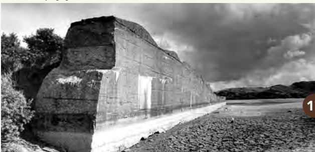
17. De tankmuur in De Pan van Persijn in 1998. Rondom de muur is nu meer begroeiing.

Hier ben je aan het andere uiteinde van de tankgracht. Aan beide zijden van de gracht werd een strook van 200 meter breed vrijgehouden van begroeiing. De Duitsers hadden zo een vrij schietveld en de vijand kon zich niet verschansen. In de oorlog liep de gracht iets verder door en sloot aan op een tankmuur en drakentanden in het duingebied Berkheide. Aan de overzijde van de tankgracht ligt het voormalige vliegveld. Lees er meer over op het informatiepaneel.