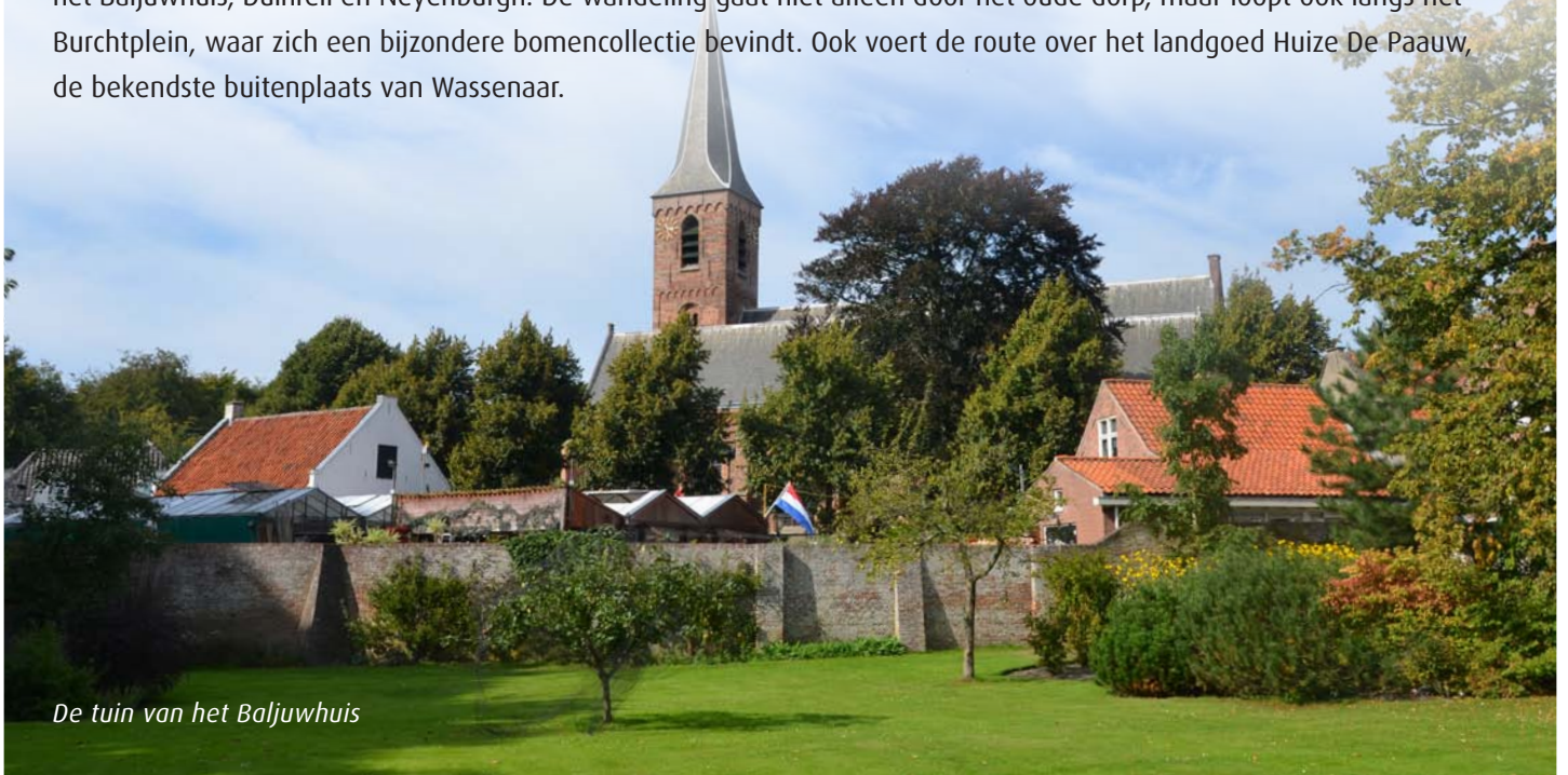
De tuin van het Baljuwhuis

Wassenaar staat in de top drie van Nederlandse gemeenten met de meeste landgoederen en buitenplaatsen. Een deel hiervan bevindt zich in en rondom het oude dorpscentrum. Het is een goede uitvalsbasis voor een afwisselende route die begint en eindigt bij de oude dorpskern. Hier werden langs de uitvalswegen buitenverblijven aangelegd als het Baljuwhuis, Duinrell en Neyenburgh. De wandeling gaat niet alleen door het oude dorp, maar loopt ook langs het Burchtplein, waar zich een bijzondere bomencollectie bevindt. Ook voert de route over het landgoed Huize De Paauw, de bekendste buitenplaats van Wassenaar.