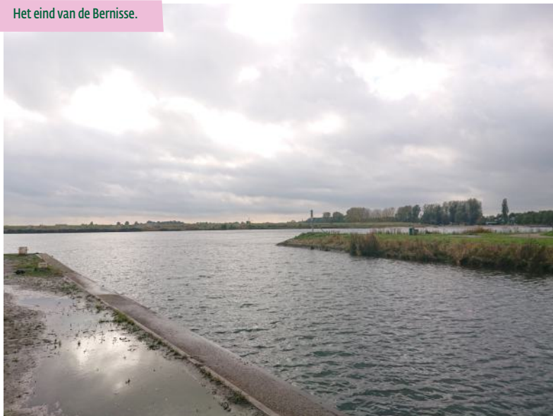
Het eind van de Bernisse.

Ga na de brug linksaf richting 84 , hier rechtsaf naar Simonshaven .