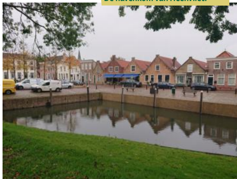
De havenkom van Heenvliet.

Tegenover Geervliet ligt Heenvliet . Heenvliet ligt op de Voornse oever van de Bernisse. De vroegere insteekhaven van Heenvliet is nog goed te herkennen langs de Toldam – een herinnering aan de middeleeuwse tolheffing. Vlakbij ligt de Markt, met mooie huizen uit de 18de eeuw.