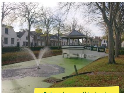
De havenkom van Abbenbroek.

Zuidland kreeg pas tolrechten en stapelmarktrechten in het midden van de 14de eeuw. Ook hier werd een haven aangelegd binnen een ring. Nu ligt ook hier een vijver: het restant van de Zuidlandse havenkom.