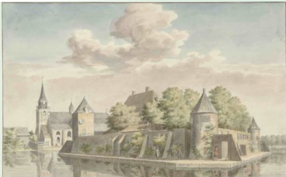
Het Hof van Putten en de kerk van Geervliet. (Tekenaar Cornelis Pronk 1749-1757)