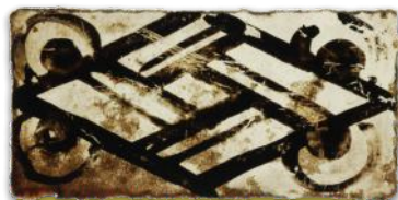
Bij archeologisch onderzoek op de plek van de Hof van Putten werd dit bijzonder

Wat de open Zeeuwse en Hollandse wateren aan welvaart brachten, konden ze ook even gemakkelijk weer afnemen. Hoe machtig de graven en de heren ook waren, ze konden niets beginnen tegen de geleidelijke verzanding van de Bernisse, en zeker niet tegen de catastrofale Sint-Elisabethsvloed van 1421. Die veroorzaakte een doorbraak ten oosten van Putten: het Spui, en dat bleek een aantrekkelijk alternatief voor de scheepvaart. Het verlenen van stadsrechten aan Geervliet (1381) en Heenvliet (1469) veranderde niets aan het feit dat de bloeitijd van de havenplaatjes voorbij was. De Bernisse werd geleidelijk ingepolderd, tot alleen een brede sloot overbleef.