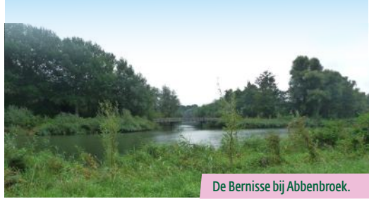
De Bernisse bij Abbenbroek.

water, vormde in de Middeleeuwen een verbinding tussen het Haringvliet en de Maasmond, en daarmee tussen Vlaanderen, Zeeland en Holland.